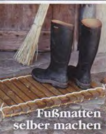
Fußmatten selber machen