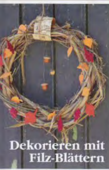
Dekorieren mit Filz-Blättern

Osterreich 5,30 € • Schweiz 9,30 sfr • Benelux, F 5,50 € • it, Sp, Port. (cont.)